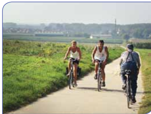
Vergezicht op Neerhespen

De naam Hespen is nog niet met zekerheid verklaard. De dorpsnaam zou komen van het Germaanse woord 'hasp' wat 'weide' of 'kromming' betekent. In 1684 brandden de Fransen het dorp geheel af. Ze lieten slechts één huis staan. In 1693 onderging het dorp nog eens hetzelfde lot. De Sint-Mauritiuskerk staat bekend om haar doopvont uit de 11e of 12e eeuw.