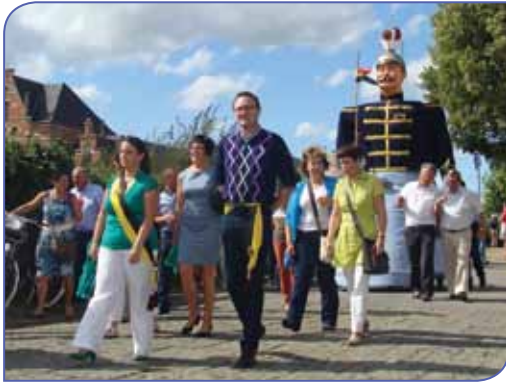
Optocht met reuzeninwoner kapitein Knapen