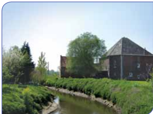
Watermolen Drieslinter, de zijarm van de Grote Gete, die de molen van water voorzag, werd in de jaren zeventig gedempt.

de aanleg van de “Uzeren Weg”, een spoorweg met als traject Tienen - Sint-Truiden - Tongeren en Tienen - Diest. Vooral suikerbieten, kolen, cement, stro en meststoffen werden vervoerd. Ook tal van mijnwerkers uit de omliggende dorpen vertrokken van hieruit richting Luik of Charleroi.