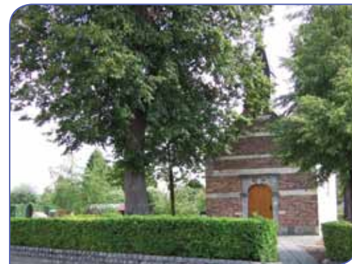
Aan de St. Luciakapel wordt vooral om genezing gebid

St.Foillanuskerk, pomp met beeld St. Foillanus, oude jongensschool, voormalig gemeentehuis en meisjesschool (dorpsplein), oude station/seinhuisje (Oude Spoorweg), pastorie van Neerlinter, kasteel van Neerlinter en Villa Delacroix (Kasteelstraat), St.Luciakapel (Heidestraat), Natuurreservaat Doysbroek (Doysbroeckweg)