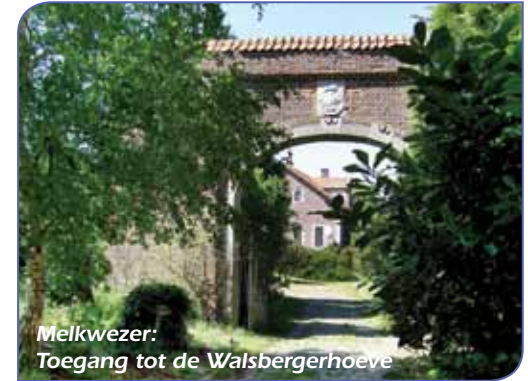
Melkwezer: Toegang tot de Walsbergerhoeve