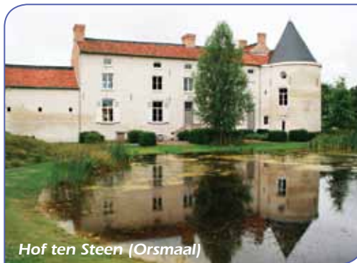
Hof ten Steen (Orsmaal)

Zalen: Voetbalkantine WS Wommersom, Klein Broekstraat 52B, tel: 016/78.91.35, Parochiezaal, Sint Kwintenstraat 21, tel: 0476/56.82.15, Zaal Carlo, Sint Kwintenstraat 21, tel: 016/78.80.33