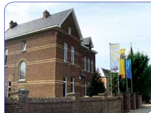
Het museum werd in augustus 2012 ingehuldigd

Museum Derde Regiment Lansiers, 3de Regiment Lansiersstraat 59, mail: museum@linter.be