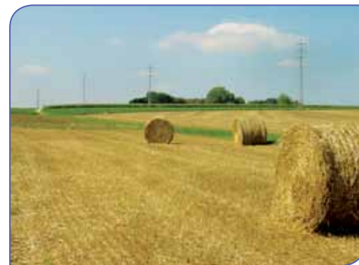
De Oude Tiense Weg (Overhespen): in de Romeinse tijd een stuk heirbaan van het traject Tienen - Tongeren

oorlogen met Luik en van de Franse (17e eeuw) en Duitse legers (Wereldoorlog I en II). Evenals Neerhespen behoorde Overhespen tot in 1963 tot de provincie Luik.