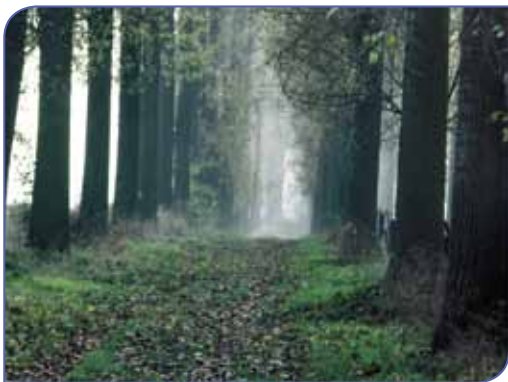
Verdwenen dreef aan het Walsbergenbos

Melkwezer (405 inwoners ) ligt op de zuidelijke helling van de Getevallei. Het dorp behoorde onder de naam Wezer vanaf 1383 tot 1795 tot de Vrijheid Zoutleeuw en was ook op parochiaal vlak niet zelfstandig. De naam Wezer is volgens naamkundigen een voorhistorische waternaam en betekent 'modderige beek', of 'drassig land'. Melkwezer heette in 1645 ook Wezeren brabant tegenover Walswezeren Luys (het huidige Wezeren, deelgemeente van Landen). Het later toegevoegde 'melk' wijst op de talrijke weiden die Wezer telde. Maar volgens een volkse vertelling was Keizer Karel er ooit op jacht en vroeg hij de bewoners water voor zijn honden. In plaats van water brachten ze melk, wat hem enorm trof. Als blijk van genegenheid noemde hij het dorp voortaan Melk-Wezer! In 1675 komt het dorp voor als Melcqweser onder Leeuwe, in 1703 als melckwesere en in 1711 als Melckwezer.