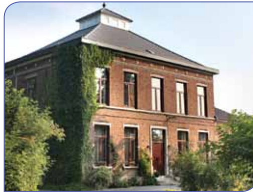
De Engeling (Melkwezer) dateert uit de 19de eeuw

Dorp), Kapel van het H.Hart (Kempeneersstraat), Hoeve Kempeneers (Bareelstraat), gedenksteen kapitein Dethier en trainingsschool van de dienst Hondensteun van de federale politie (Laarweg)