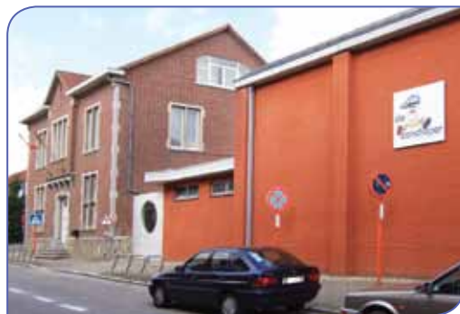
De gemeentelijke basisschool werd de afgelopen jaren fors uitgebreid

Kleuterschool, Langstraat 27, tel: 016/78.97.01