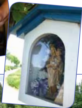
Onder: kapellekensboom (Wommersom)