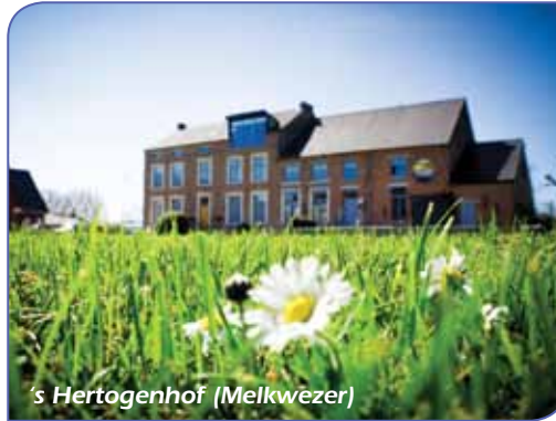
's Hertogenhof (Melkwezer)

Zalen: Voetbalkantine SC Orsmaal, Helen-Bosstraat, tel: 011/78.12.28, Parochiezaal, Oude Kerkstraat, tel: 011/78.07.12