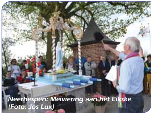
Neerhespen: Meiviering aan het Eikske

Zalen: Parochiezaal 'De Brukkes', Langstraat 54A, tel: 016/78.93.32