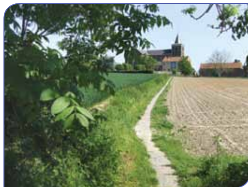
Pad richting Sint-Foillanuskerk te Neerlinter

1914, toen Duitsers 76 woningen vernielden. De Sint-Foillanuskerk is het resultaat van verschillende bouwcampagnes die reeds in de 15de eeuw startten. Op het dorpsplein prijkt een standbeeld van de patroonheilige boven een waterpomp, die in 1860 geïnstalleerd werd. Een brand verwoestte in 1693 gedeeltelijk het kasteel van Neerlinter, gelegen op een omgracht domein. In het begin van de 18de eeuw werd het heropgebouwd en later uitgebreid. Op 27 mei 1878 reed de eerste trein langs het traject Tienen-Diest. In 1894 werd Neerlinter Dorp op aanvraag als stopplaats geopend.