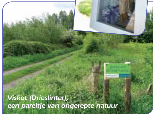
Viskot (Drieslinter), een pareltje van ongerepte natuur