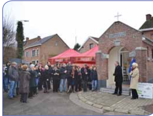
Inhoudiging gerenoveerde kapel OLV van Bijstand

De Sint Mauritiuskerk; met kanonskogel in gevel, Oude pastorie, Heilig Kruiskapel, Kasteel van Neerhespen, voormalig gemeentehuis en schoolhuis, hoeve Lammens, hoeve Grené en huis Vangoitsenhoven (Langstraat), Sint-Annakapel (hoek Langstraat), St. Rochuskapel (Achter het