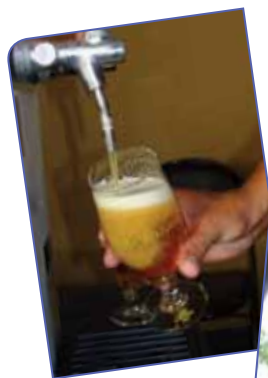
Links: een vers getapte Walsberger Blond

Huisbrouwerij Lestedröppel (Helen-Bosstraat 71) is op iedere vierde zondag van de maand tussen 13 en 18u geopend. Het laatste weekend van augustus zijn er de Walsberger Bierfeesten. Meer info: www.facebook.com/dewalsberger