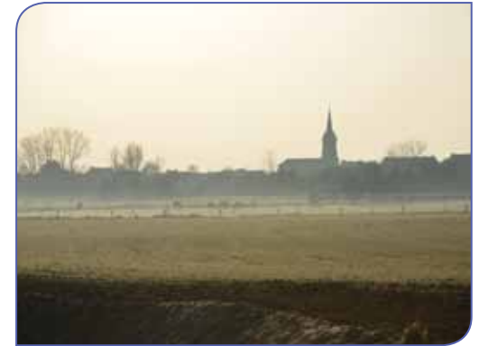
Dorpsgezicht van Wommersom

trokken op plundertocht, de Gete stroomde over, graanoogsten mislukten, pest en melaatsheid braken uit. Er bleven slechts 200 bewoners over. Tot 1559 behoorde Wommersom tot het bisdom Luik. De bekende dichteres Julia Tulkens-Boddaer (1902-1995) woonde een tijd lang in Huize Wissebos in Wommersom.